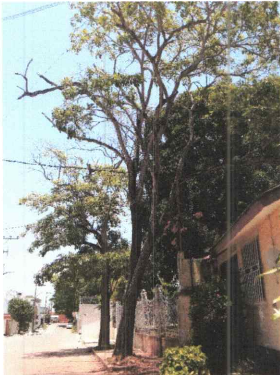
Foto 1. Vista lateral donde se logra apreciar una inclinación aprox. de 30° hacia la casa del ciudadano, de igual manera se observa la obstrucción de las ramas en el cableado eléctrico